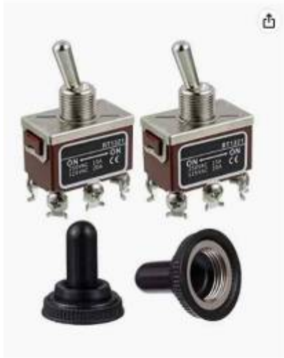
Passez la souris sur l'image pour zoomer