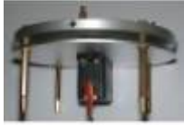
◦ la base