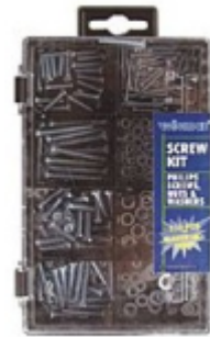
◦ Vis (exemple...)