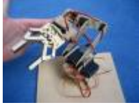
◦ les pièces en 3D