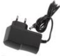
◦ Alim 5v 2,5a