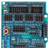
◦ Sensor shield V5