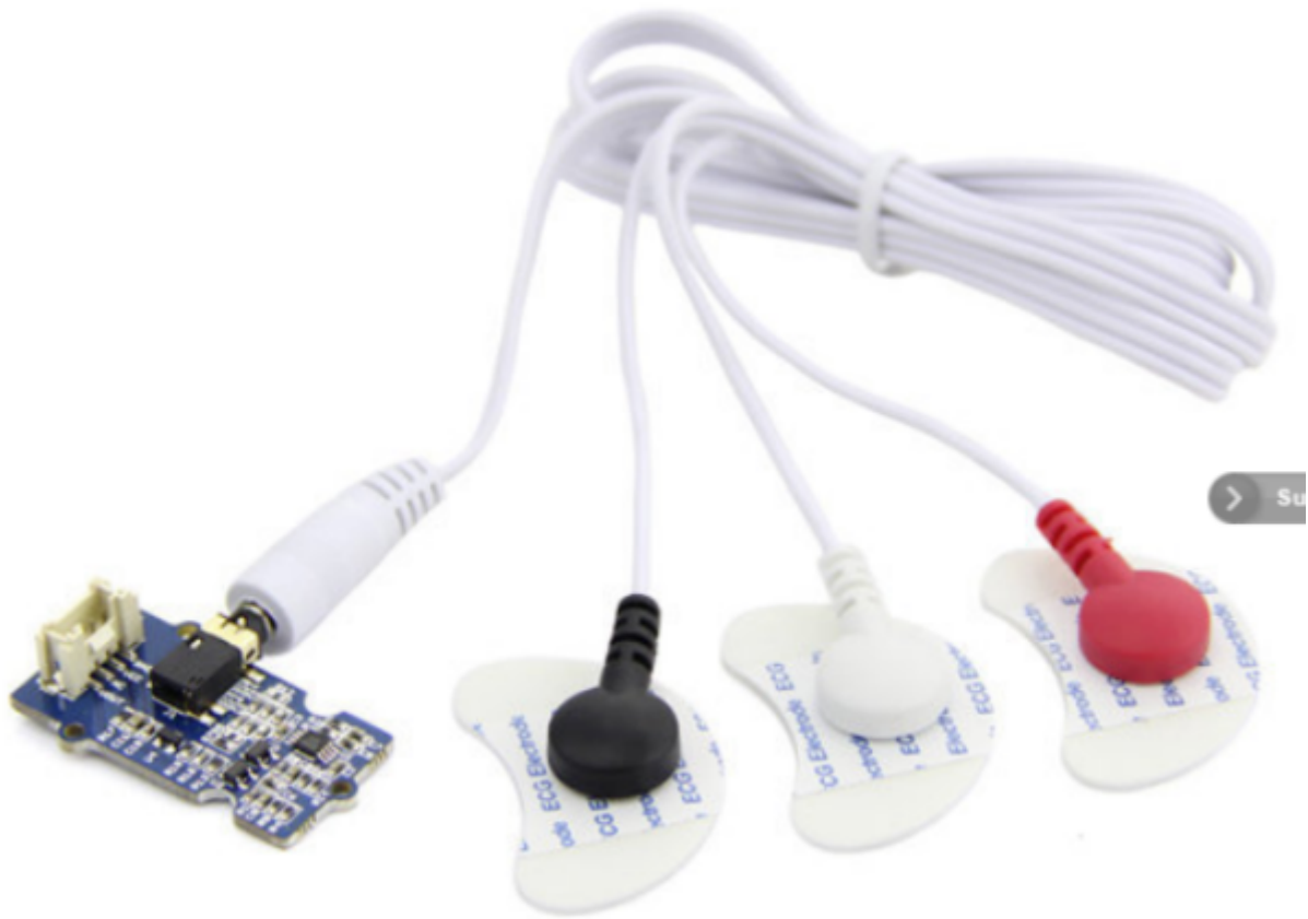
EMG Grove Gotronic