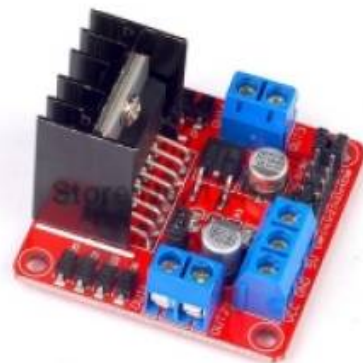
Carte de contrôle des moteurs (L298N – « double pont en H ») :