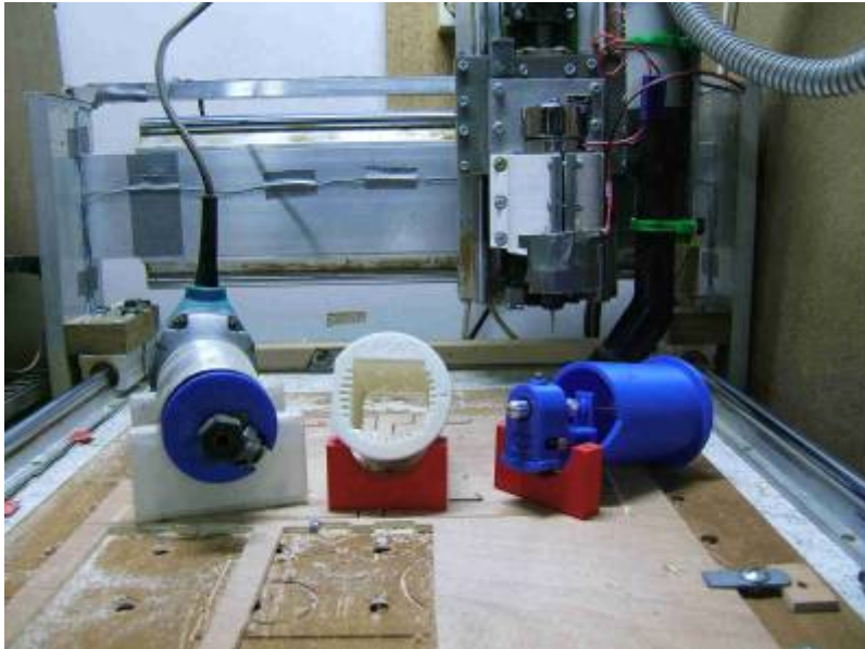
-3- détail de l'axe X