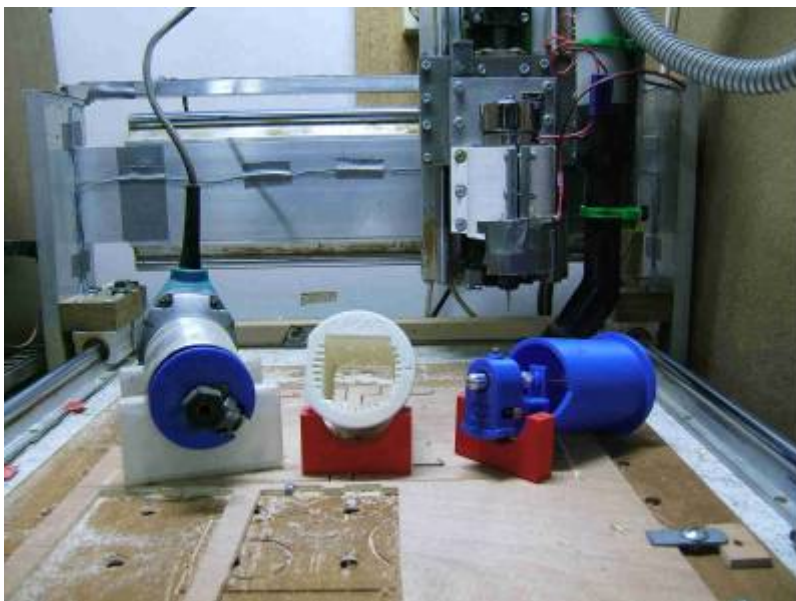
-3- détail de l'axe X

start:projets:alain https://magenealogie.chanterie37.fr/www/fablab37110/doku.php?id=start:projets:alain&rev=1608634560